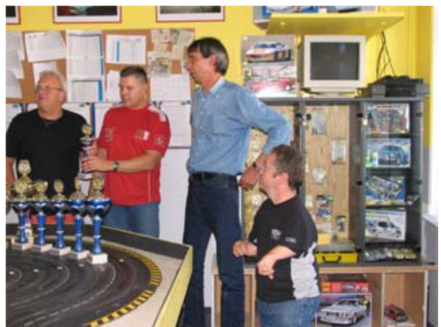
Hier war mehr „drin“ - Team KHB Bombenleger . . . !? !?

Dafür lief's bei New-Man Racing , dem Team der neuen Männer aus dem SRC Niederrhein (woanders heißt das Rookies !!), die mit Unterstützung von zwei alten Hasen den Titel „Best of the Rest“ errangen und in einem furiosen Schlusspurt die erfahrenen Heimascaaris von KHB Bombenleger niederrangen, welche am Ende ein wenig demotiviert wirkten (aber doch sicherlich nicht deshalb !? !?) . . .