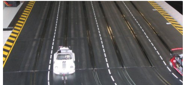
Holles Porsche 911 Targa

sollte er seinen Vorsprung dann weiter ausbauen.