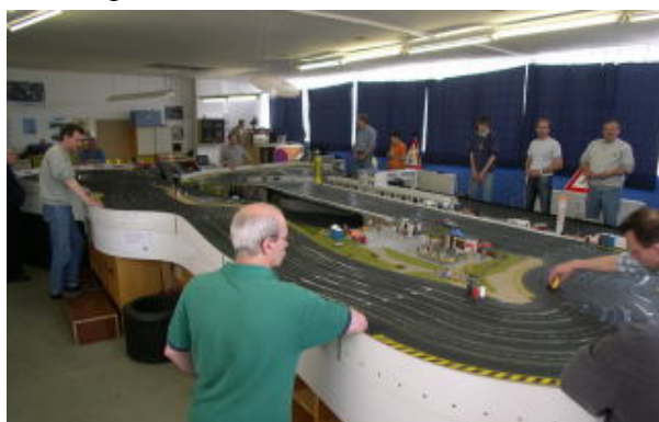
Rennatmosphäre im ScaRaDo . . .

Jeder der langjährigen VSC Slotter erinnert sich gerne an das Abschlussrennen 2004, bei welchem der VSC Master Wanderpokal erstmalig überreicht wurde. Nun richten die Jungs von ScaRaDo den 6. Saisonlauf der VSC am kommenden Samstag aus. Und ich denke mal, dass wir alle aus dem Urlaub zurück sind, und somit das Starterfeld wieder eine stattliche Zahl ergibt.