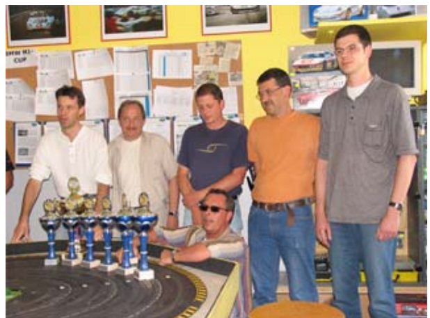
In Moers heißen Rookies schlicht „New-Men“ - Team New-Man als Best of the Rest . . .

Die Jungs des Teams Checkered Flag - im Vorjahr immerhin Dritte - waren höher eingeschätzt worden. Obwohl technische Probleme ausblieben (das kann sich niemand erlauben, der vorne fahren will), lief's nicht so rund. Ein gravierendes Problem war nicht auszumachen - also war's wohl die Summe der Kleinigkeiten . . . !? !?