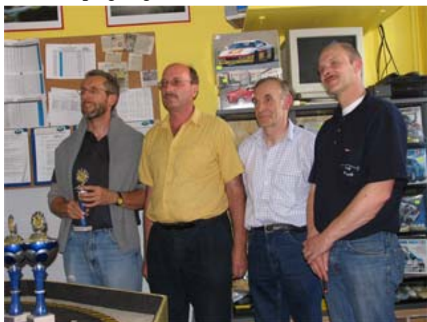
„Zipperlein“ während der Nacht - Team HaJü Racing . . .

boys. Hier musste also bis zum Schluss mit Volldampf gefightet werden . . .