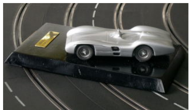
VSC-Master Wanderpokal - wer erkämpft ihn 2005 . . .

Mir liegen keine Informationen über neu erstellte Slotcars vor. Aber wenn ich in den Kaffeesatz schaue, könnte ich mir vorstellen, dass besonders im Hinblick auf die DSC einige 75 mm Boliden neu erstanden sind.