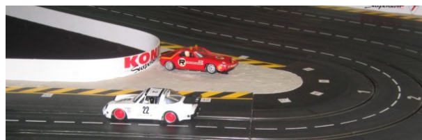
Porsche 928 S - ONS Streckensicherung

Für die Teilnehmer begann das Training ab 10.00 Uhr. Bereits im Vorbericht wurde über die Anwesenheit der ONS Streckensicherung spekuliert. Lupo stellte einen Porsche 928S der ONS Streckensicherung. Thomas prüfte mit dem ONS Porsche die Sicherheit der Strecke. Auslaufzonen sind in ausreichender Menge vorhanden, so konnte das Training freigegeben werden.