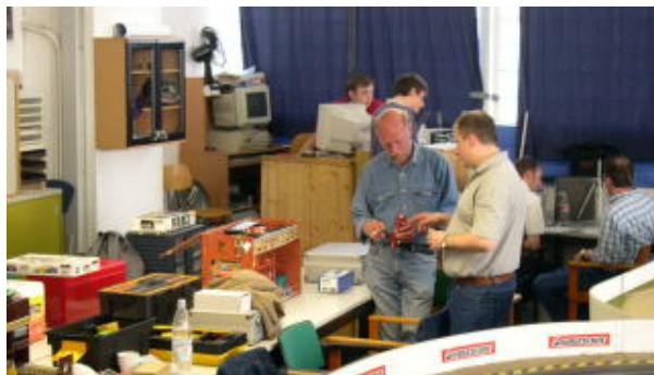
Fahrerlager im ScaRaDo . . .

Jeder der langjährigen VSC Slotter erinnert sich gerne an das Abschlussrennen 2004, bei welchem der VSC Master Wanderpokal erstmalig überreicht wurde. Nun richten die Jungs von ScaRaDo den 6. Saisonlauf der VSC am kommenden Samstag aus. Und ich denke mal, dass wir alle aus dem Urlaub zurück sind, und somit das Starterfeld wieder eine stattliche Zahl ergibt.