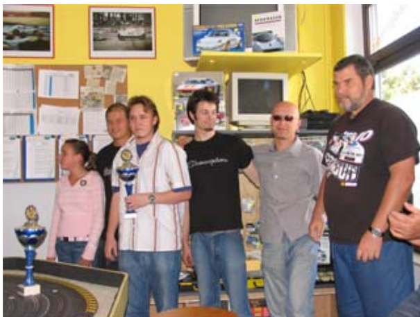
Nix „Drinking“, nur „Racing“ - Team Schwerte 1 mit dem beinahe Allstars Team . . .

Was am Abend und in der Nacht noch viel Action versprach, reduzierte sich im letzten Drittel des Rennens auf einen wirklich packenden Fight um Platz 9 . . . die Flying Dutchman zollten dem Zwei-Personen-Team Tribut und die Kölner Jungs kamen im Finale gegen die Two-Man-Show der Scuderia Moers nicht an, die ihrer Geheimfavoriten Rolle wirklich gerecht geworden sind . . .