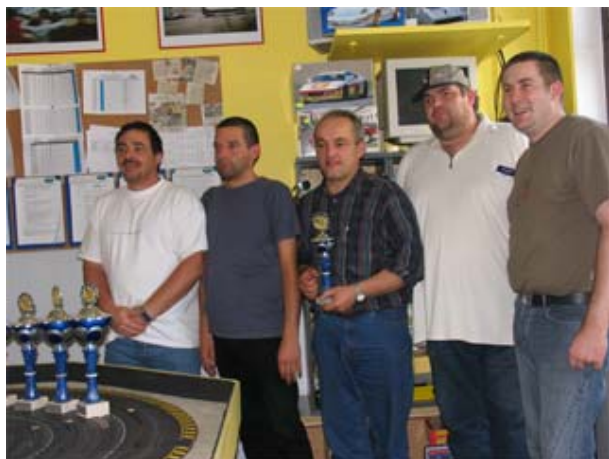
Schwerte 1 und 2 (hier Team 2) ganz solide - die Ruhe vor dem Sturm . . . !? !?

Das traditionelle Grillen begann ab 20:15h und etliche Teams übten starke Zurückhaltung im Bierkonsum. Besonders auffällig wurden hier die Schwerter Teammitglieder !! Was das nun wieder bedeuten sollte . . . ☺ ☺