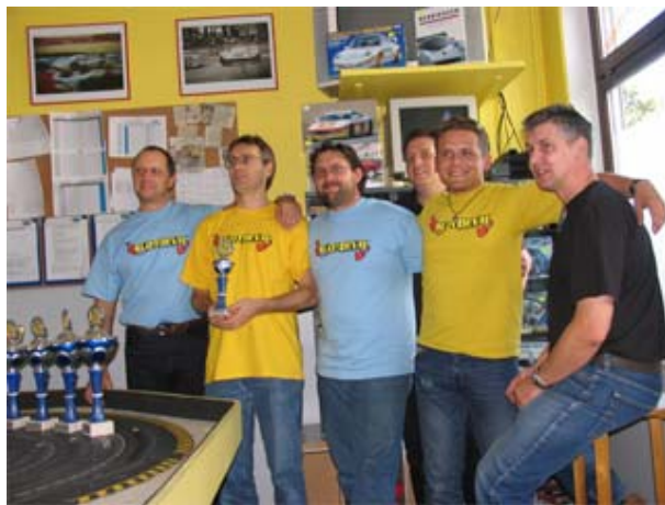
Früh vom technischen Pech verfolgt - Team Slotdevil . . .

Lediglich das Team Slotdevil war bislang vom technischen Pech gebeutelt und hatte ein wenig den Anschluss an den Rest des Feldes verloren.