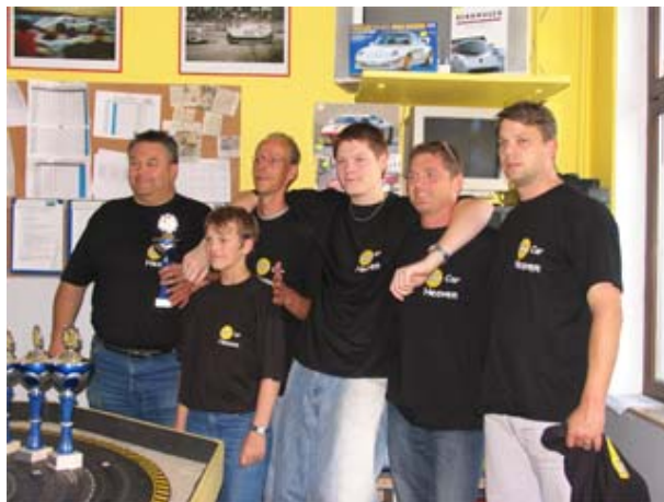
Checkered Flag bereits früh (ab-)geschlagen . . .

den. Lediglich Checkered Flag war bereits deutlich abgeschlagen . . .