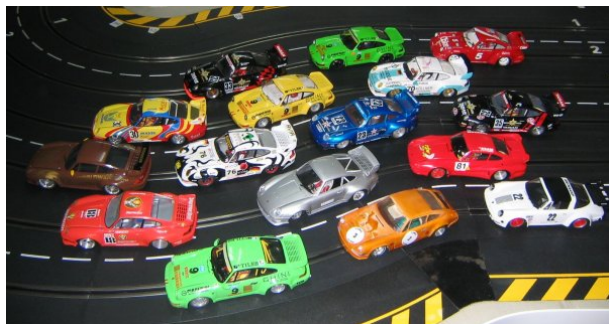
Porsche Cup 2005 – Slotpoint in Herzebrock