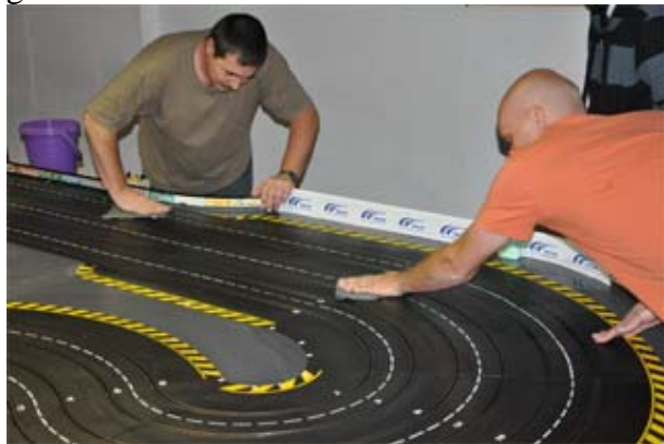
Putz as putz can . . . ☺☺

Die Operation Bahnputzen ging für den SLP-Cup in Schwerte heuer in die fünfte Runde – sofern man das SLP-Cup Meeting in Alsdorf mit einrechnet. Mittlerweile haben die Beteiligten hier viel Routine und die Zahl der Helfer ist groß, sodass dieses Kapitel rasch abgehakt werden kann . . .