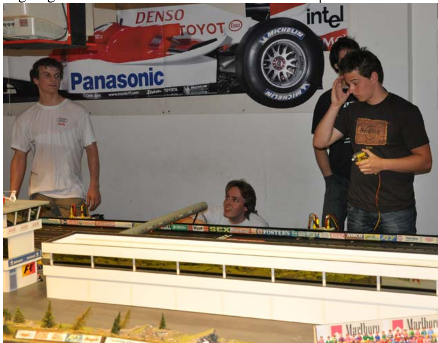
Die vier PQ – Jan 2 vom anstrengenden Duell sichtlich mitgenommen . . .

ihrer Startspur in etwa das Tempo der 3. Startgruppe zu gehen – hier war also ein Fernduell angesagt . . .