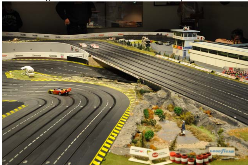
Vor der letzten Spur: Viel trennt Jan 2 nicht – JanU links, JanS hinten Mitte . . .

Im Verlauf des Rennens bestätigte sich das Gros der Prognosen nach dem ersten Rennschstel. Sebastian war in argen technischen Problemen – und hatte keine Idee, wo der Fehler am „Plastikquäler“ 962 liegen sollte. Auf Traumrunden folgten Chaosrunden – ohne jede Berechenbarkeit. Vernünftigerweise fuhr er im Folgenden mit gebremsten Schaum und versuchte, die Kollegen nicht rennentscheidend zu behindern – war also nur noch als eine Art Dummy unterwegs. Schade, dass der mög-