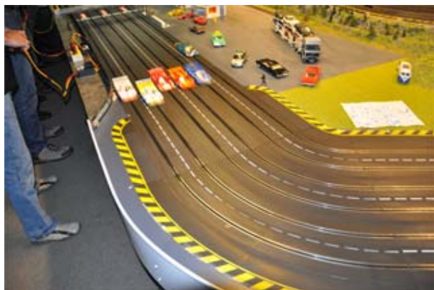
Ring frei für die 3. Startgruppe – Ralf Leenen geht knapp in Führung . . .

Vorweg: Um die Positionen 1 bis 4 dieser Gruppe wurde fortwährend und vehement gefightet. Zwar ergaben sich am Ende jeweils Abstände von ein bis zwei Runden – sie spiegeln den Rennverlauf und das Engagement der Beteiligten jedoch nur bedingt wider . . . !!