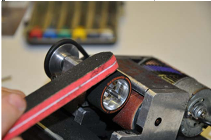
Die Bearbeitung der Pneu bringt mehr Grip . .

Ziel der Putzübung war wie immer, ein gleichmäßiges Gripniveau über alle sechs Spuren – sogar in Schwerte, wo bekanntlich viel Moosgummi im Club gefahren wird (zusammen mit GP Bereifung). Im Unterschied zur Gruppe 245 ist das Gripniveau beim SLP-Cup deutlich höher, da keine (unbehandelten / unbearbeiteten) Räder ausgegeben, sondern eigene und somit geschliffene ProComp-3 Pneu gefahren werden . . .