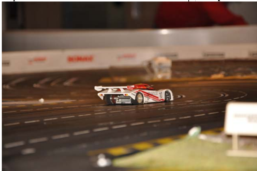
Ein „Kenwood“ auf der Abfahrt zum Tunnel . . | lang