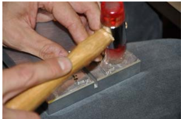
Hier hämmert sich jemand auf P4 vor . . . ☺☺

Damit kamen – bislang nie da gewesene – 25 Starter für das Finale zusammen . . . !!