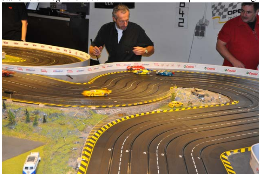
Erste Startgruppe, erste Kurve – nur Drei kamen durch . . . !!☺☺

Vier Startgruppen mit insgesamt 25 Teilnehmern machten sich gegen 13:45 Uhr auf die Räder, um binnen 60 Minuten netto Fahrzeit möglichst oft die erweiterte Acht in Schwerte zu umrunden. Davor hatten die Veranstalter allerdings für jede Gruppe noch ein einminütiges Warmup gestellt, um allen Fahrern die letzten Eindrücke zum Streckenzustand zu ermöglichen . . .