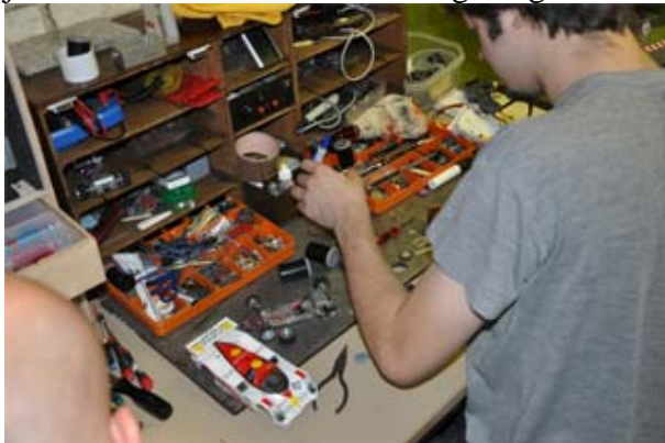
Versinnbildlichung des Begriffs „Workshop“ . .

Die drei versammelten Plastikquäler schraubten wie üblich bis zum bitteren Ende und dabei die Rundenzeiten bis in den 6.6er Bereich nach unten. Für die Normalsterblichen blieb die 7.0s Schallmauer zu überwinden, was im Training jedoch erstaunlich vielen Folks gelang . . . !!