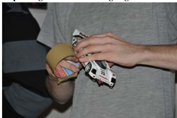
Nach dem Putzen folgt langweg Abrollen . . .

Ein Volt weniger als im Vorjahr lautete die Vorgabe bezüglich der Bahnspannung . Mit 18 Volt hatte man im Mai bei der S.R.I.G.