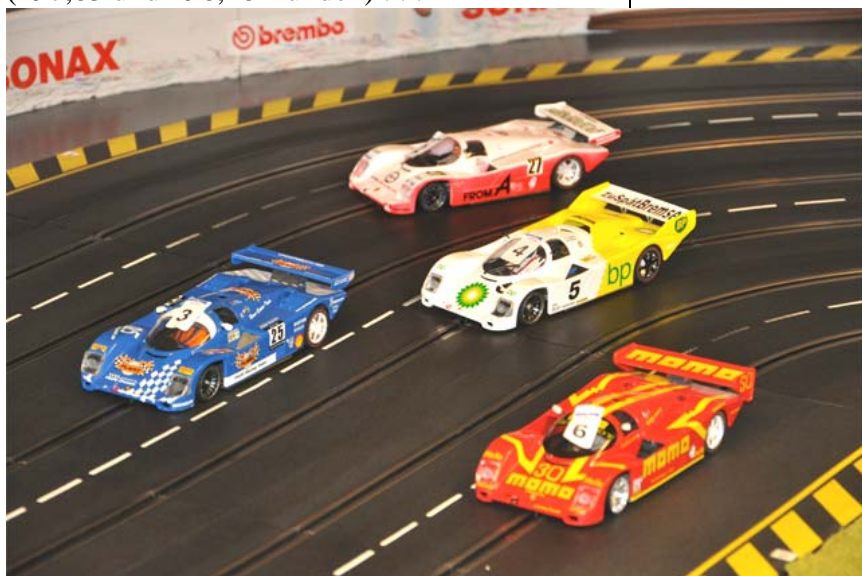
Knappe Kiste: Hier die Routiniers Stracke („Plafit“) und Eifler („Momo“) knapp vor Leenen („BP“) und Ohlig („Modellparadies“) . . .

Beginnen wir mit der Überraschung des Tages: Frank Ohlig errang mit 499,14 den Sieg in dieser Gruppe – das war P4 in der Tageswertung ! Dirk Stracke musste sich am Ende um gut eine Runde geschlagen geben, stand aber selbst wiederum massiv unter Druck von HaJü Eifler (497,83 und 496,48 Runden) . . .