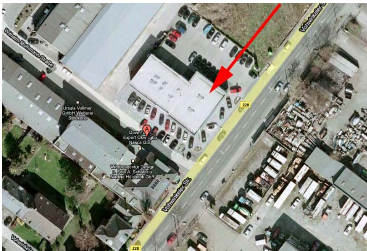
Das Luftbild: Orientierungspunkt ist das Saab / Subaru Autohaus Oestreich (Pfeil). Direkt gegenüber befindet sich der Eingang zur Bahn (das rote „A“) . . .

Nachfolgend die Detailinformationen zum Rennen am Samstag, den 9. Oktober 2010: