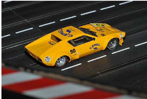
Die ex-aequo P3 aus 2012 für die DeTomasos wird in diesem Jahr nicht wiederholt!☺