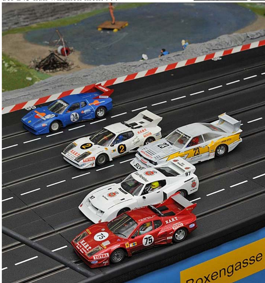
Vor dem Funktionstest anno 2012 . . .