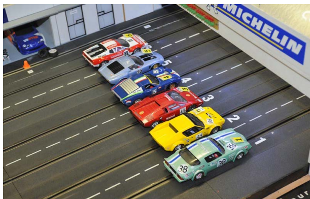
Letzter Durchgang Gr.4 Teamrennen 2012 ...

3. Lauf am 5. September 2015 in Lintfort