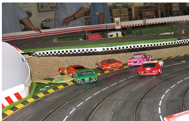
Anno 2008 - Gr.4 Teamrennen in Arnberg: Fünf Cars der schnellsten Startgruppe einwand- frei versenkt! 😊😊