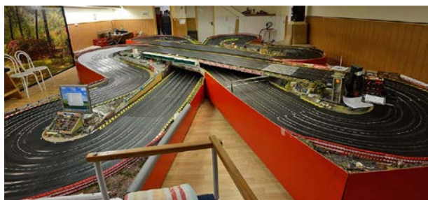
Die 44m-Bahn in Lintfort ...