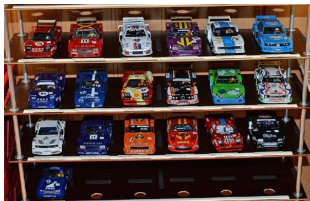
Parc Fermé Gr.5 Teamrennen 2014 ...