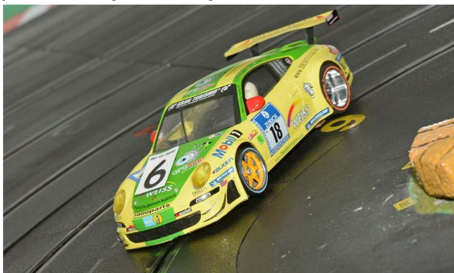
911er endlich einmal im Mittelfeld!

Glück und Pech liegen wie immer sehr dicht beieinander. Im Juni findet der nächste Lauf statt. Da kann schon alles wieder ganz anders aussehen.