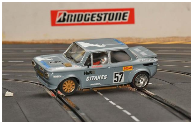
...nicht alle Stunts gehen gut!?