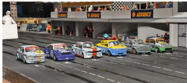
Vor dem Start . . .