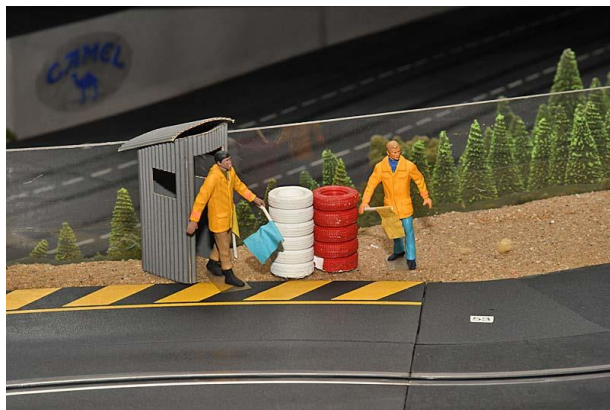
Die ScaRaDo-Posten hatten ein Jahr Zeit, sich vom Stress-Job in 2018 zu erholen . . .