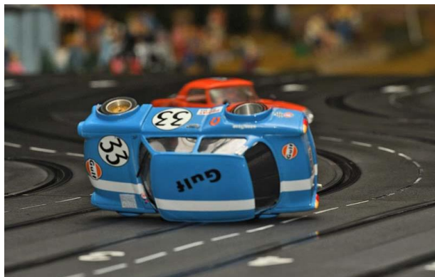
Stuntshow der Klein(st)en...

„Zwergenaufstand“ am 09.02.2019 in Dortmund