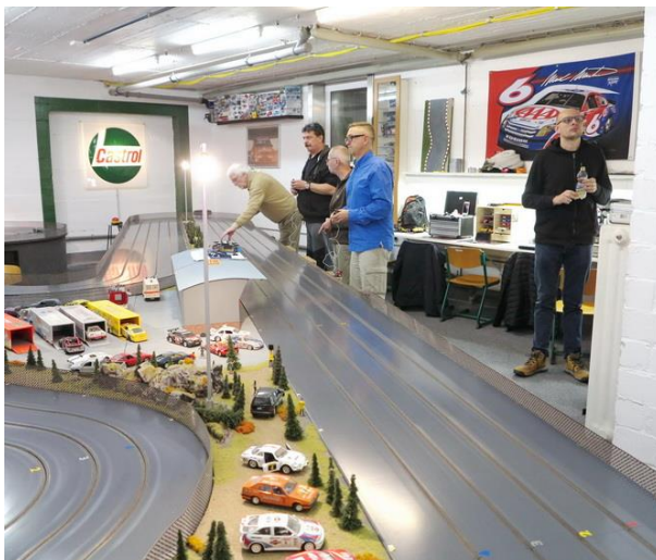
...nur ein kurzer Trainingsabend stand an.