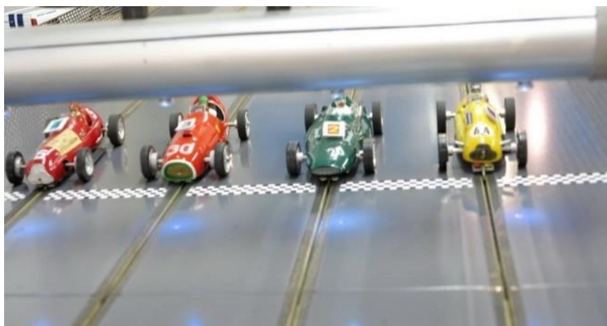
...und die Formelzigarren dazu

Dabei traten direkt vier Racer an die Bahn, die mehr als häufig, meist teilweise wöchentlich gegeneinander fahren – „neunff“, „maxi- umspeed“, „Tormentor“, „Kauli“ und seltener dabei Heiko „gastfahrer“.