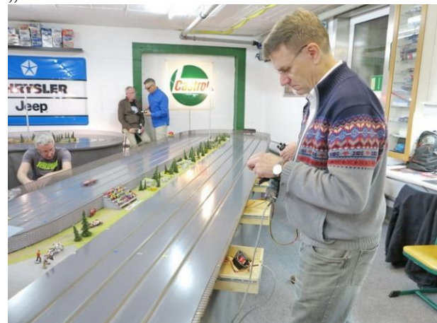
...„ronald“ hatte kaum Zeit zum Durchatmen

„Tormentor“ P4, „MaxiumsPEED“ P5 und „neuff“ auf P6.