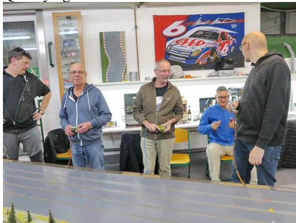
...die erste Startgruppe

Da wir nicht genau bestimmen konnten, wann „ronald + simcat“ eintreffen, entschieden wir, die erste Startgruppe ohne das sonst übliche Qualifying auf die Reise zu schicken.